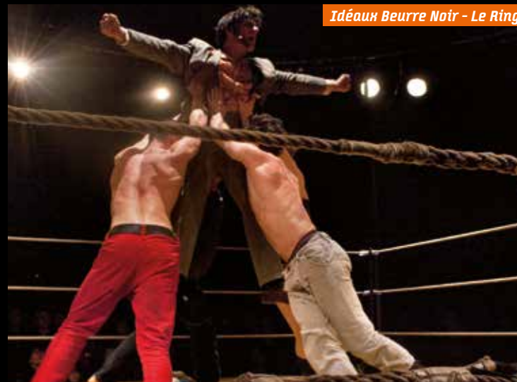
Idéaux Beurre Noir - Le Ring