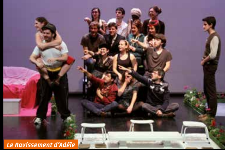
Le Ravissement d'Adèle